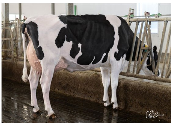
LEOTHE POSITIVE DEBUT DAUGHTER