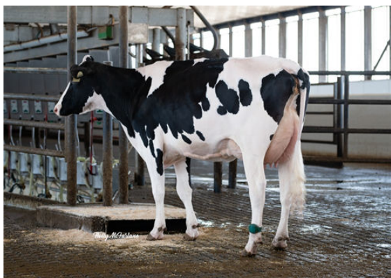
STANTONS POSITIVE POISON