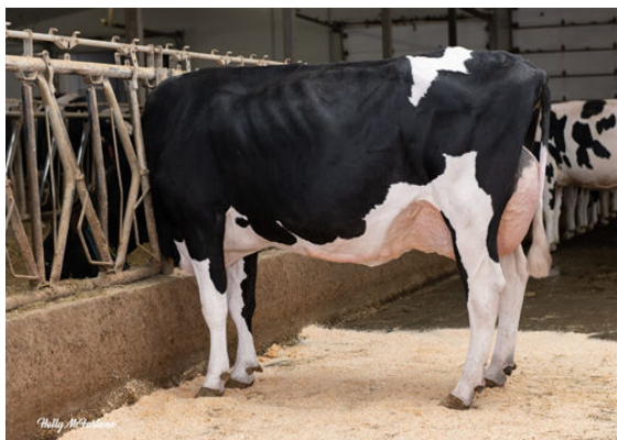
PROGENESIS POSITIVE TRILLIUM DAUGHTER