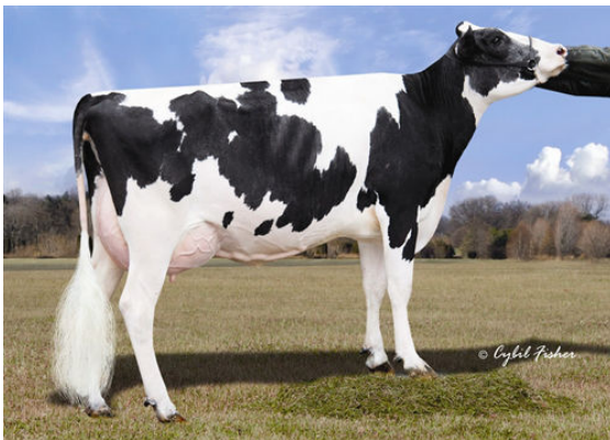
WELCOME-TEL OBSERV SADY GRANDDAM