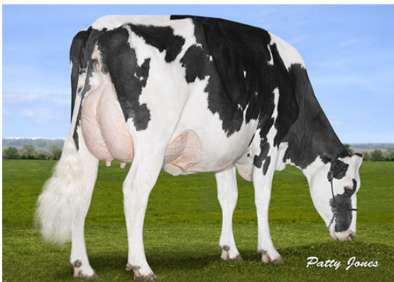
EARLEN SOLOMON MANDY