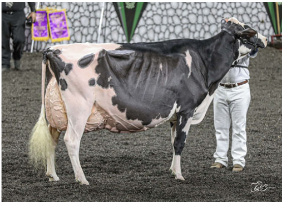
OAKFIELD SOLOM FOOTLOOSE DAUGHTER