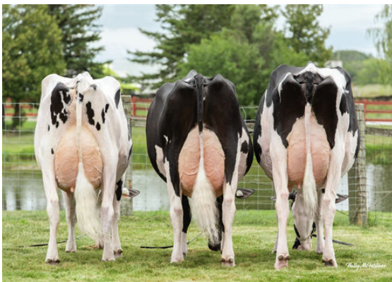
SOLOMON DAUGHTERS 3 L-R QUALITY SOLOMON LOVELY, QUALITY SOLOMON LUSTFUL, QUALITY SOLOMON LUST