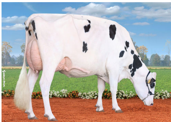
TOC-FARM FITZ FLOR