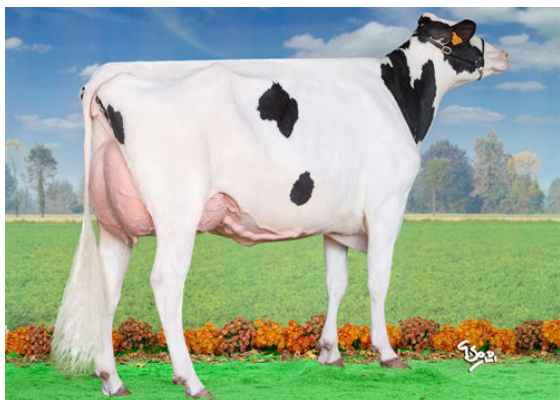
TOC-FARM 1ST GRADE FIORE