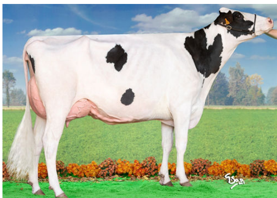
TOC-FARM 1ST GRADE FIORE