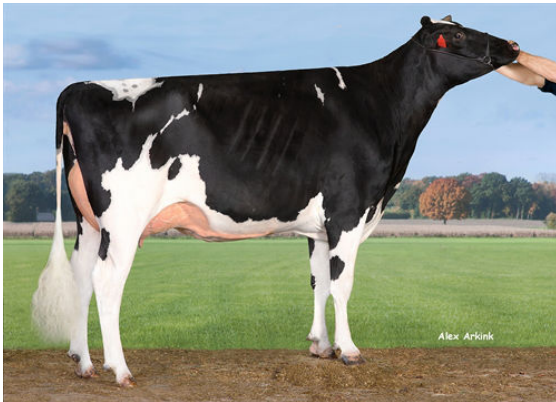
MISS MAGIC GRANDDAM