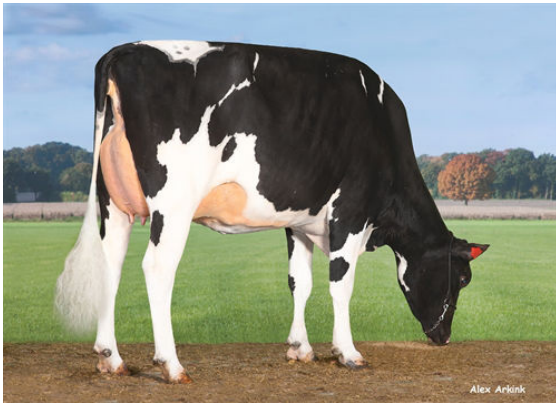
MISS MAGIC GRANDDAM