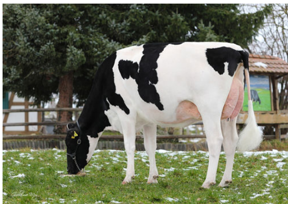
MATTENHOF TATOO HOPE DAM