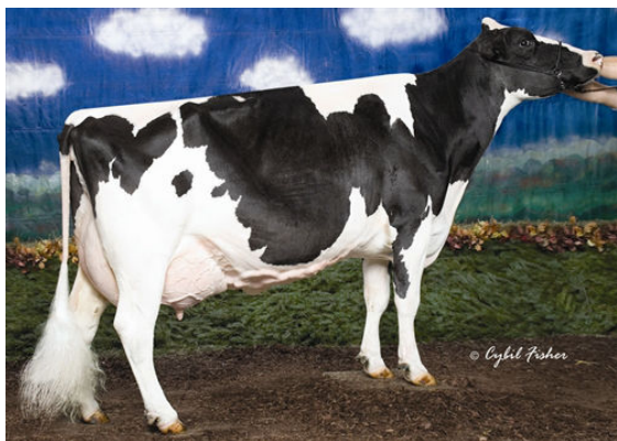
SAVAGE-LEIGH LOUISE FIFTH DAM