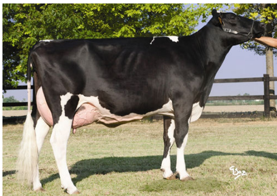
ALL.NURE ELEGANT BULLESTAR FOURTH DAM