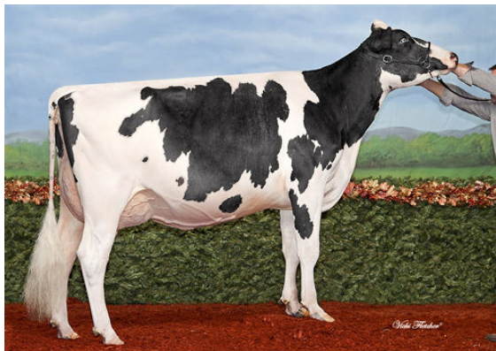
STEVAIN SALOON NOUKY