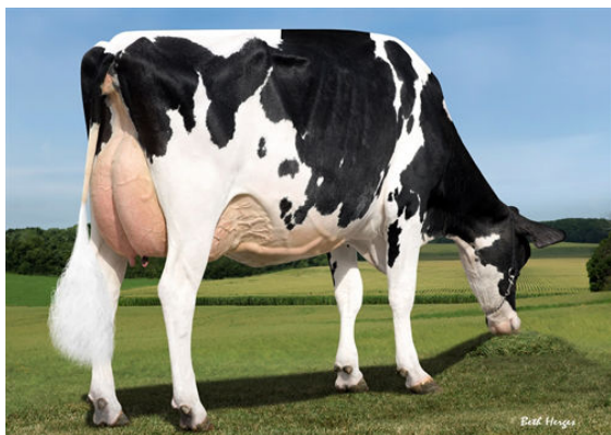
SANDY-VALLEY SALOON 5203