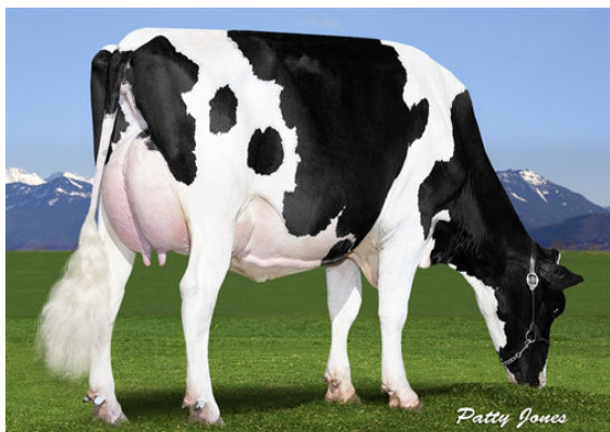
DOLPHIN SALOON 925