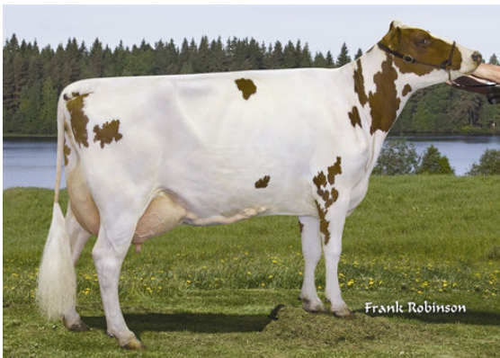
FOREVER SCHOON PRETTY FOURTH DAM