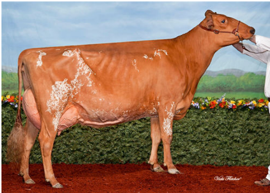
DE LA PLAINE BURDETTE BLING GRANDDAM