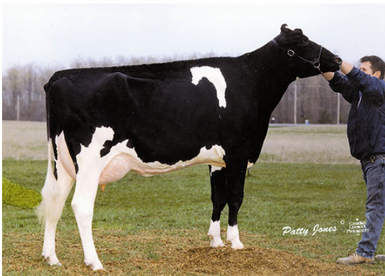
BRAEDALE BALER TWINE GRANDDAM