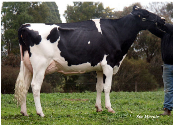
ROSEWORTHY GYPSY GRANDEUR-IMP-DAM