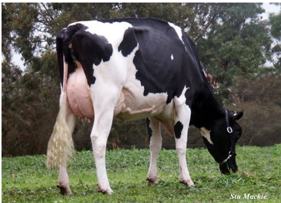
ROSEWORTHY GYPSY GRANDEUR-IMP-DAM