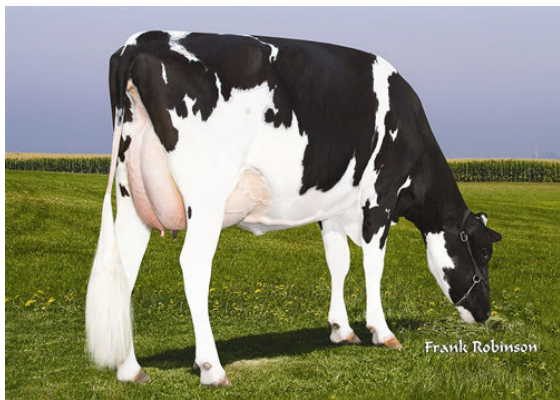
COSTA-VIEW KAMIK 42680