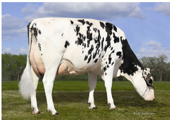
FERTILE-RIDGE KAMIK 6472