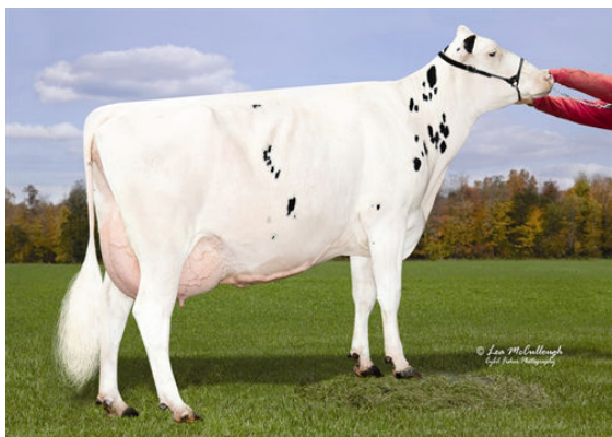
HEINZE KAMIK 2190