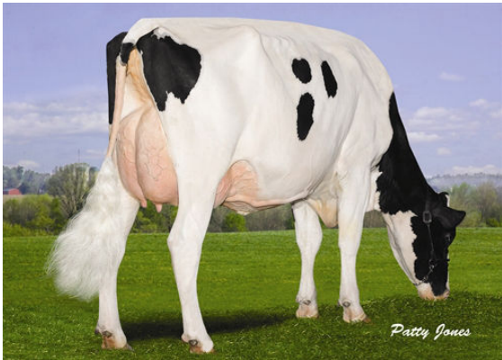
MISTY SPRINGS BIGSTONE SANDY