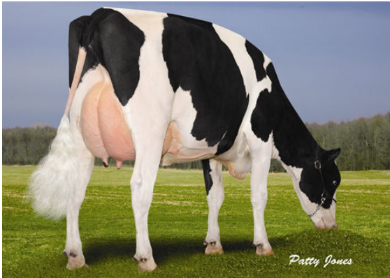
TRIKAMP BIGSTONE IVY