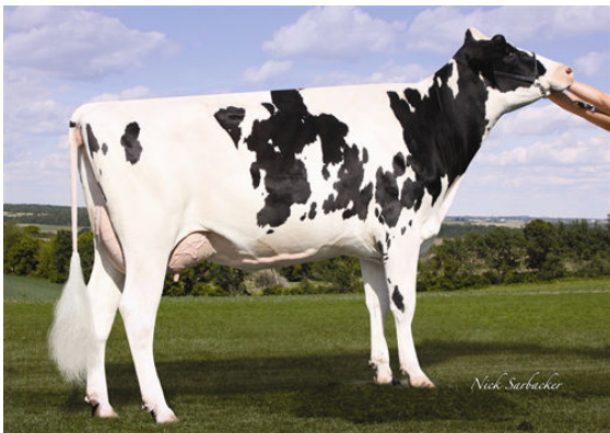
RINGA-LEA BIGSTONE 1224