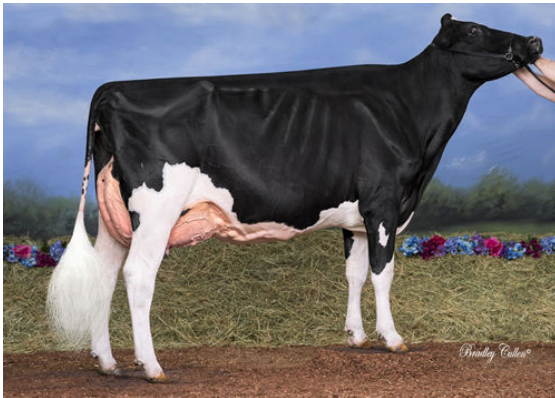
Paringa Fever Opa