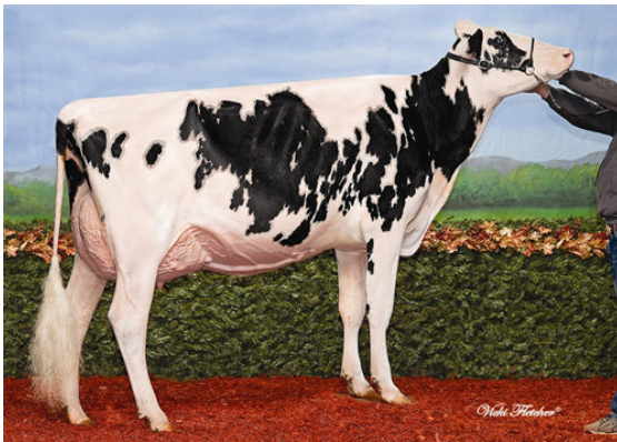
Jacobs Fever Cael