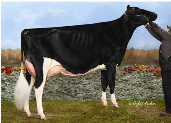
Arethusa Fever Almira