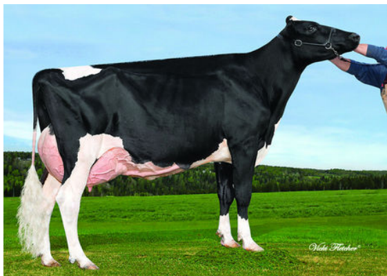
DAMIBEL MATHYS SONY