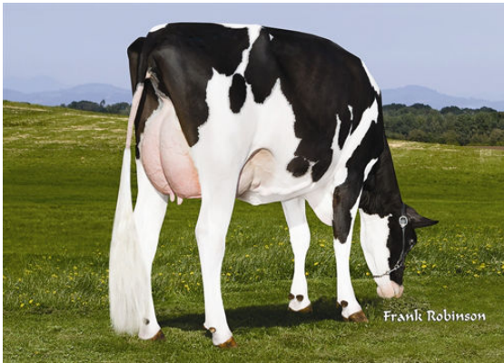
HILLTOP-MJD SPARROW 907