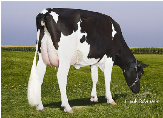
COSTA-VIEW SPARROW 43192