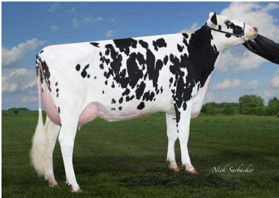
HILLTOP-LLC BOWMAN 4584