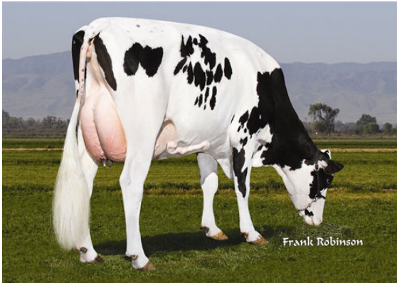
HILLTOP BOWMAN 9422