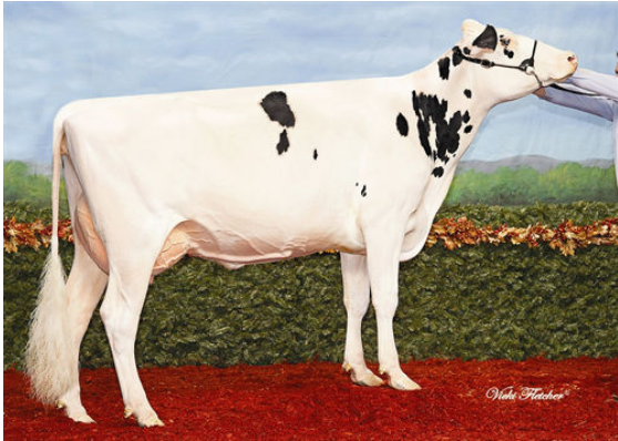
LEMAVIE BOWMAN KATRINA