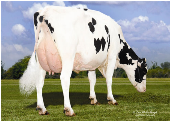
HILLTOP-LLC JETT AIR 4459