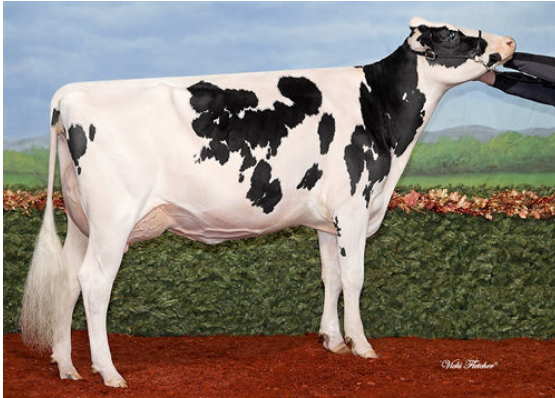
MILLBROOKE JETT AIR DIVA