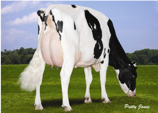
TWOMEIER JETT AIR 1956