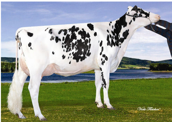
LINDENRIGHT MANIFOLD DELIGHTED