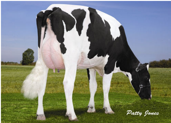
STRADOW RISINGSTAR 622