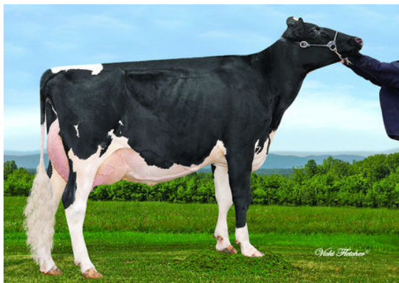
REDSTONE SLEEMAN PHILIPPA