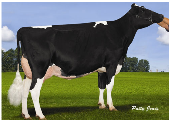
FLEVOHILL SLEEMAN TIPPY