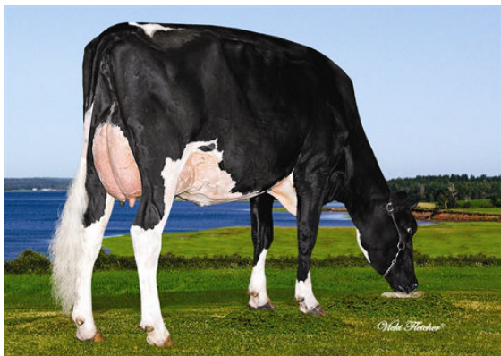
BRACKLEYFARM SMOKIN AJ

Left to Right Bernalta Smokin Bess, Misty Springs Smokin Belle, Markem Olie Smokin, Misty Springs Smokin Erin, Misty Springs Smokin Breeze, Misty Springs Smokin Sophia