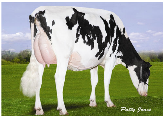
MISTY SPRINGS SMOKIN SOPHIA