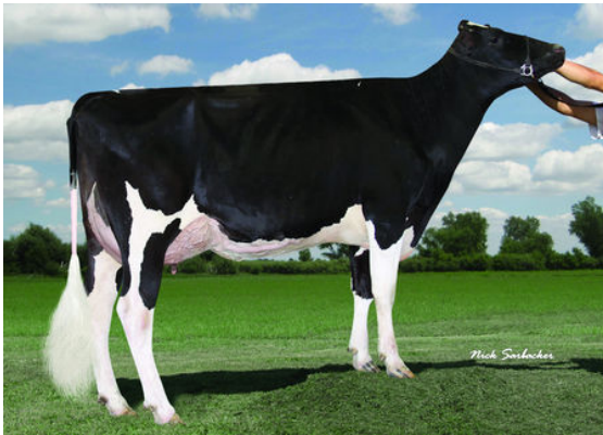
EAGLE-VIEW TEMPTING CURLY