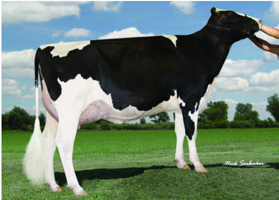
EAGLE-VIEW TEMPTING VAMPIRE