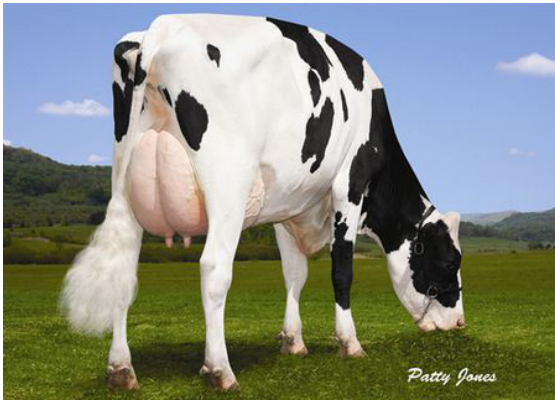
MAYACRES SONNEGA WINTER