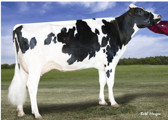
APPLIOUS JET STREAM ALDA THIRD DAM