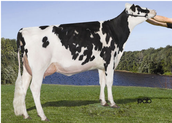
GEN-I-BEQ SNOWMAN AKILIA DAM