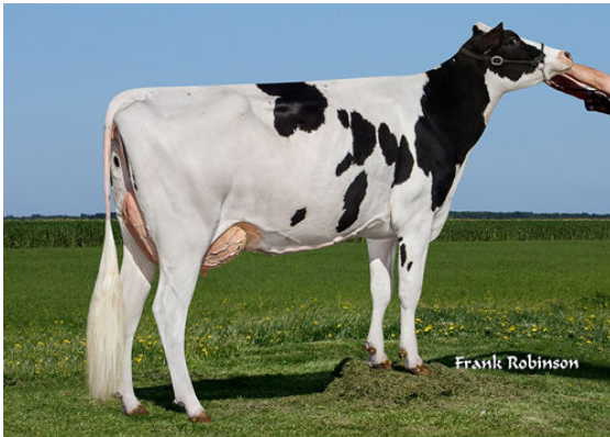
OCD MOGUL KIRSTIE ALLEY GRANDDAM