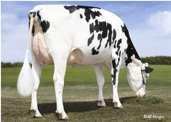
MS C-HAVEN OMAN KOOL THIRD DAM