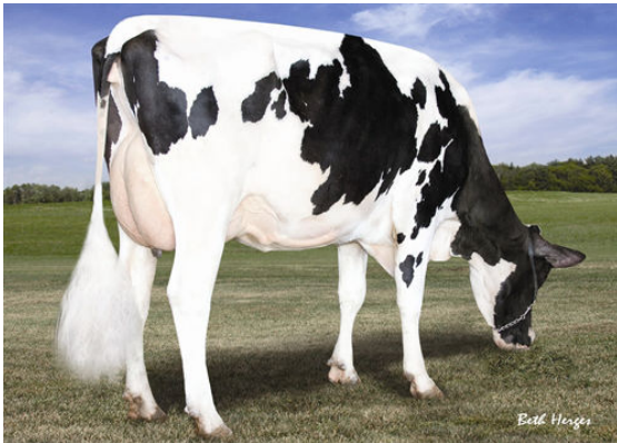
APPLouis JET STREAM ALDA THIRD DAM