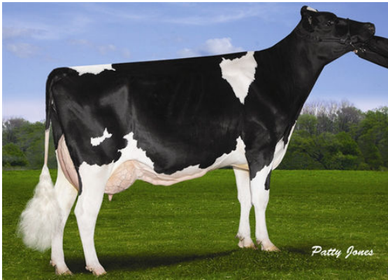
VISION-GEN SH FRD A12304 GRANDDAM