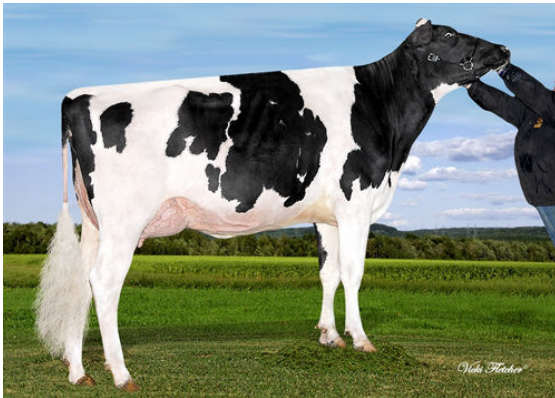
FARNEAR-TBR-BH GOOGLE GRANDDAM