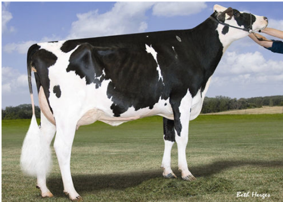
BENNER BAXTER BIG FOOT DAM