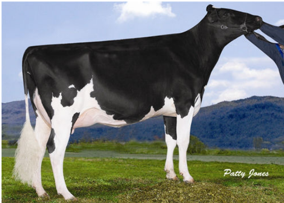
GEN-I-BEQ MORTY BARBIE GRANDDAM