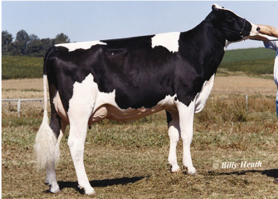
WINDSOR-MANOR ZEBEE GRANDDAM