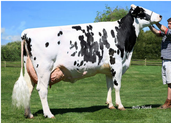
WINDSOR-MANOR ZE SHILOH DAM