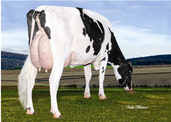
LINDENRIGHT MANIFOLD DIME