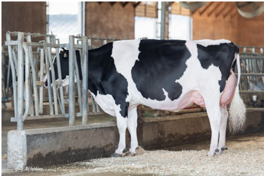
MYSTIQUE LAMBDA ANIS DAM