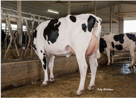
PROGENESIS TOPNOTCH BRAVE GRANDDAM