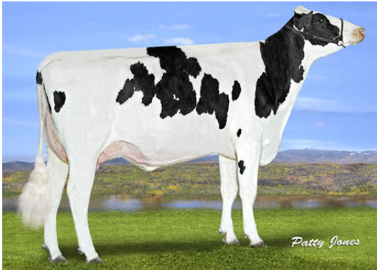
PROGENESIS MONTANA BEAUVAIS THIRD DAM