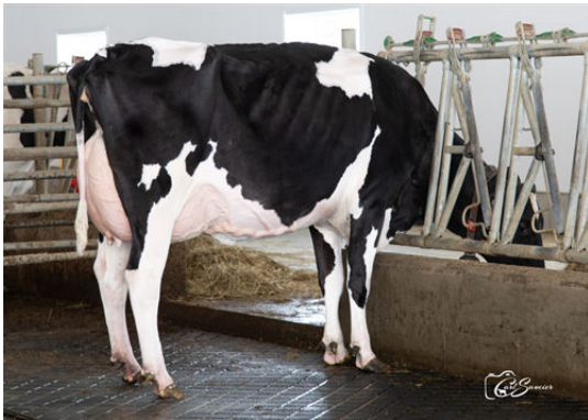
PROGENESIS PURSUIT DIETIES DAUGHTER