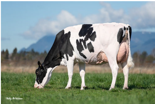
WESTCOAST PSUIT LAUMAB 8996 DAUGHTER