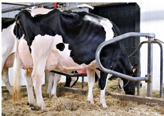
LILLVILLE RANDALL ZOEY DAUGHTER