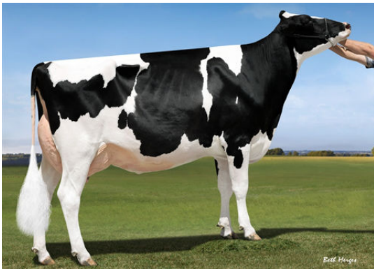
OUR-FAVORITE UNLIMITED FOURTH DAM