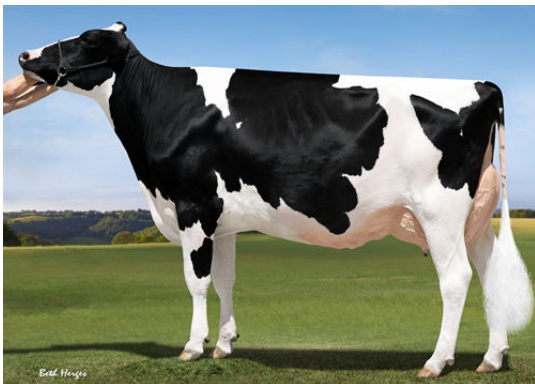
OUR-FAVORITE UNLIMITED FOURTH DAM