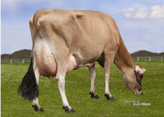
LUCKY HILL JOKER WABORITA FOURTH DAM