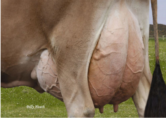
LUCKY HILL JOKER WABORITA