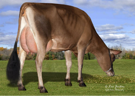
JX GENERATIONS JAMMER DORA {5} FOURTH DAM