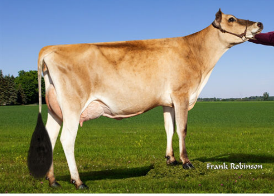
PROGENESIS DIVINE DAM