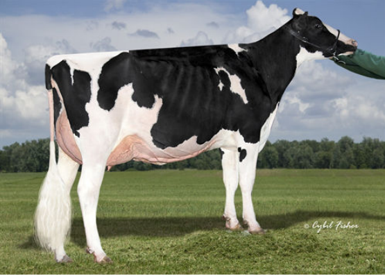
SIEMERS LBA HANINA 28047 DAM