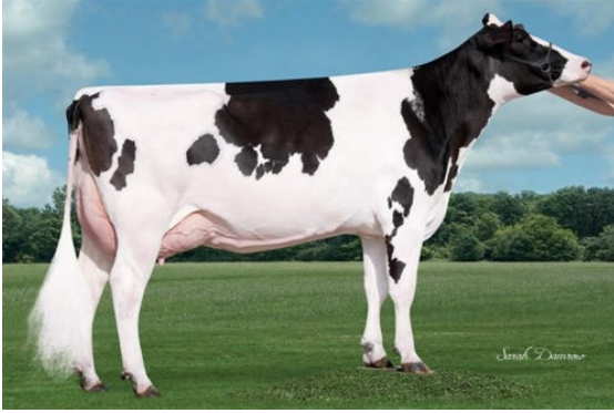
SIEMERS MCCUTCH ROZ