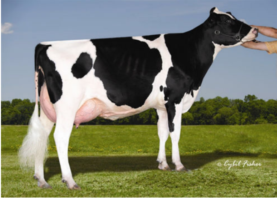
CHERRY CREST MANOMAN ROZ