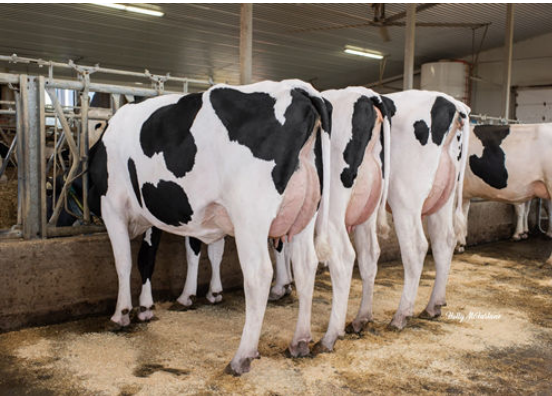
TOPNOTCH DAUGHTERS GROUP