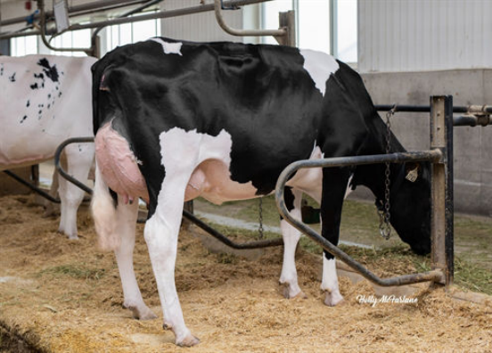
PROGENESIS TOPNOTCH OAKLEY