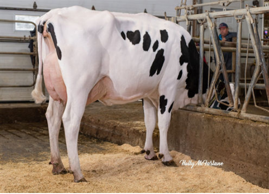
PROGENESIS TOPNOTCH MACIE