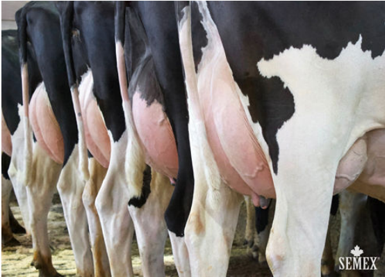
LITTLEROCK DAUGHTER GROUP