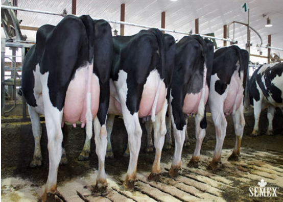
LITTLEROCK DAUGHTER GROUP