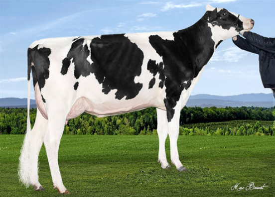
GENO BLOODY SUNDAY