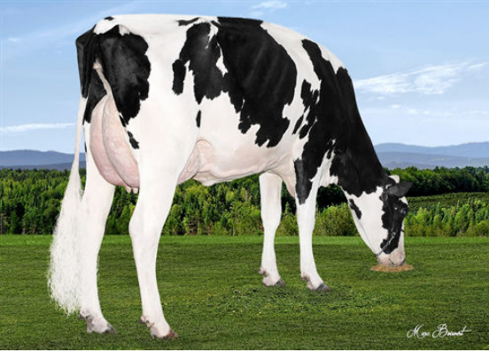
GENO BLOODY SUNDAY