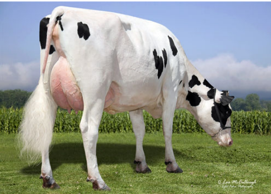
GIL-GAR DEDUCT FANCY