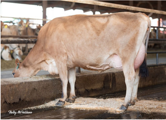
JX PROGENESIS MINNIE {5}