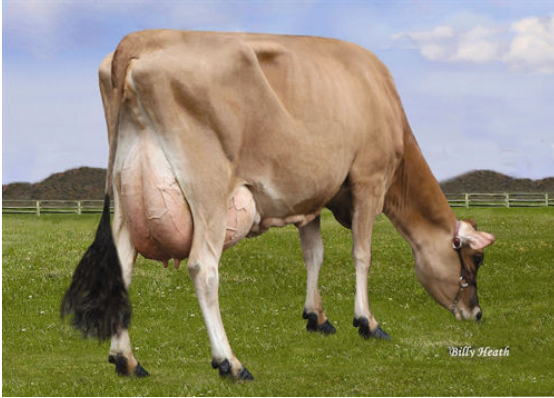
LUCKY HILL JOKER WABORITA FOURTH DAM