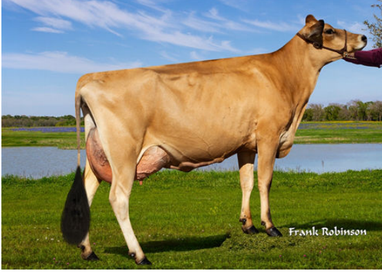
JX LUCKY HILL WILDFLOWER {6} GRANDDAM