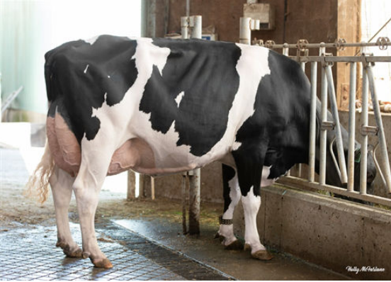
PROGENESIS YODA PALOMA