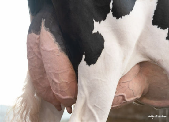
PROGENESIS YODA PALOMA