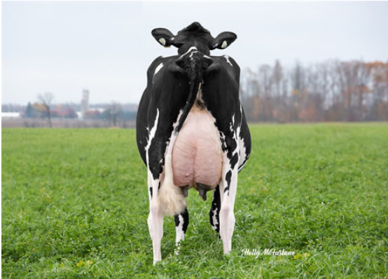
CARL DOT WINDMILL LAYLA