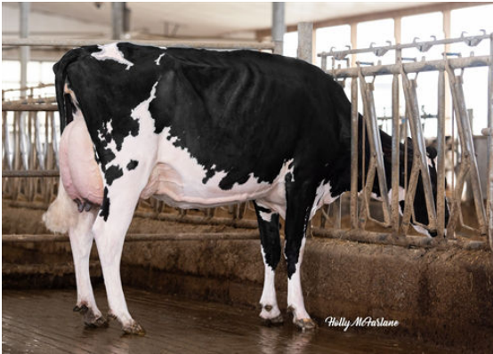
CARL DOT WINDMILL LAYLA